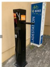
Reparatur und Ladestation Bibliothek Grafenrheinfeld

Online-Kalender Veranstaltungen und Events im Schweinfurter Mainbogen ist installiert und bietet die Funktion der digitalen Übertragung auf private Kalender.